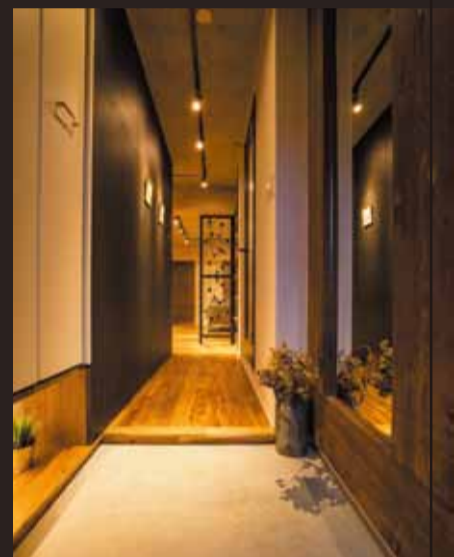
玄関には天井まである木製ハイトミラーを設置。大切なゲストに圧迫感を感じさせません。