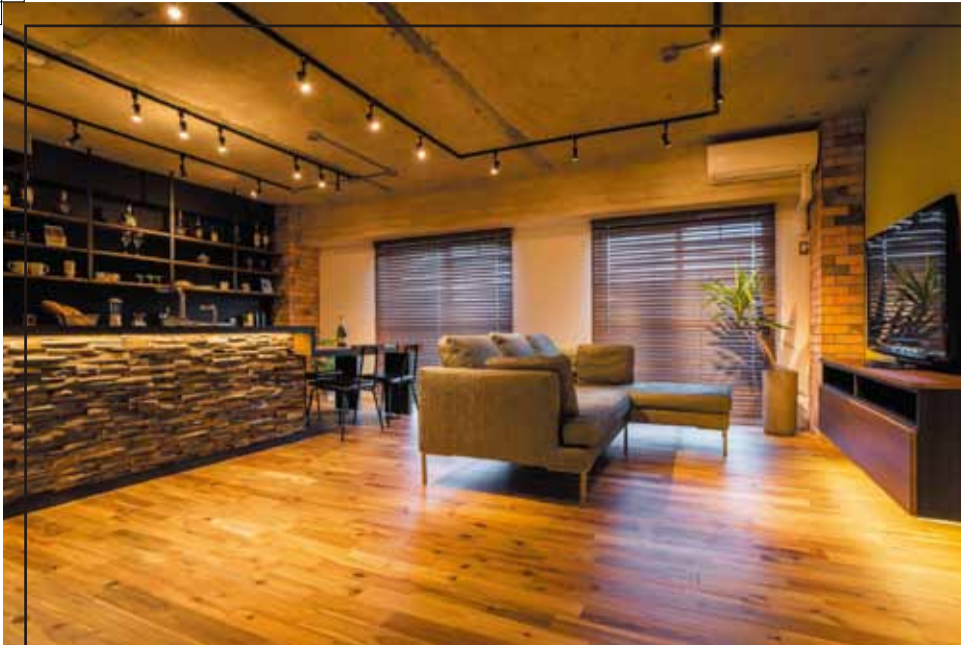
約21帖のLDKは大型のカウチソファも余裕でレイアウト可能。床には天然木の「アカシア」を採用。