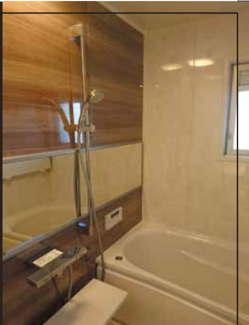
木目を基調にしたユニットバス。