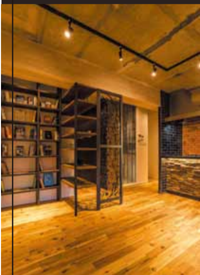
見せることを楽しむ重量感と上質感のある書棚とアイアンラック。