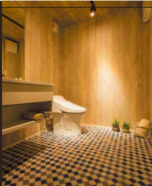
サニタリーinトイレという発想。