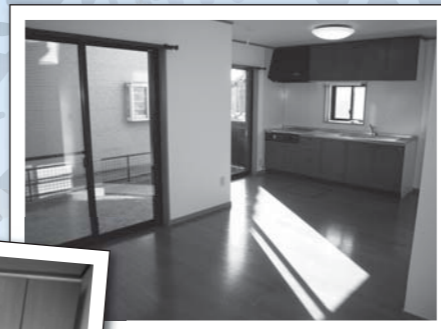
ウッド調のナチュラルなキッチン