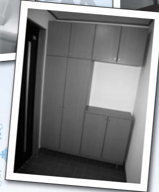
散らかりがちな玄関も スッキリ片付く大型下駄箱