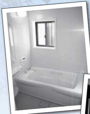
白で統一された 清潔感のある浴室