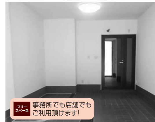
■フリースペース 事務所でも店舗でもご利用頂けます!