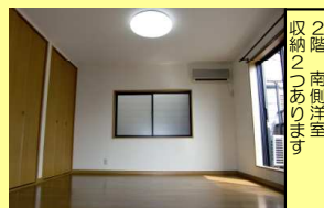
2階の洋和室 フローリング 壁紙

閑静な住宅街に中古物件が登場しました!! 近くに商業施設多く便利な場所です! ★人気のカウンターキッチン ★南側は駐車場なので日当たり良好 ★追焚き機能有 ★1階2階 トイレ有 ★洗髪洗面化粧台 ★TVインターホン付き お気軽にご内覧下さい!! 平日でもご案内可能です。 (水曜日定休)