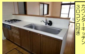
カウンターキッチン 80cm幅