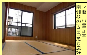
2階の洋和室 フローリング 壁紙