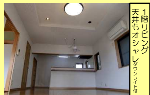
1階リビング 天井ホリゾンツキ フローリング